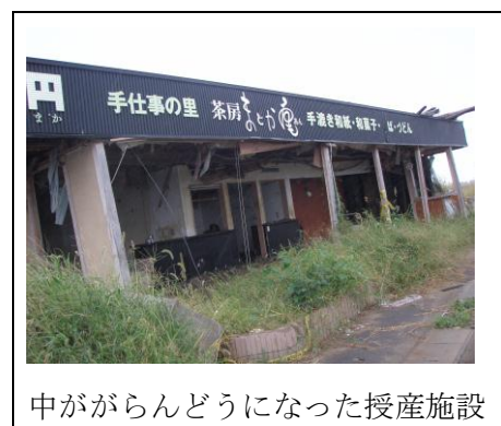
中ががらんどろになった授産施設

塩釜に向かう途中、小さな授産施設に寄りました。看板は残っていましたが中はがらんどろ。無残な状況です。みんなは避難したのですが、もし迎えに来る人がいたらと避難場所を書いた紙を壁に貼りに戻った職員はみんなの所に戻ってこなかったそうです。手を合わせました。