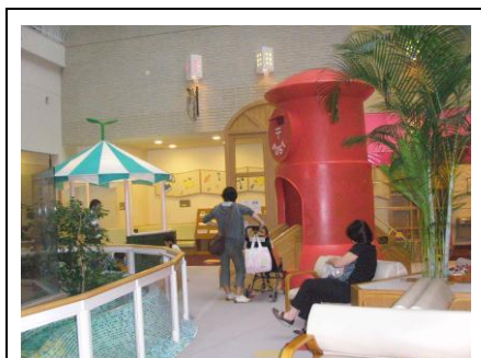
赤いポストの滑り台

まず建物全景が病院という雰囲気ではなくしゃれた色使いとデザインに改めて最初に訪れたときに感じた印象を思い出しました。まず玄関に入ってびっくり。やはりおとぎの国です。大きな赤いポストの滑り台、4回までの吹き抜けの壁にはまるで建物の外のような可愛い窓がいっぱい。カラフルなビー玉が天井に埋め込まれた丸いエレベーターは大人の私が「乗りたい！」と叫ぶほど魅力的です。